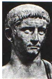
Kaiser Claudius 69