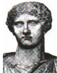
Valeria Messalina (25 – 48 n. Chr.) 60

die ihren Plänen im Wege stehen oder ihr gefährlich erscheinen, hinrichten lässt („...multasque mortes iussu Messalinae patratas“ 63 ). Agrippina, seine vierte Gattin, lässt ihre Herrschsucht walten („ad spem dominationis“ 64 ) und tut alles, damit ihr Sohn Nero der nächste Kaiser wird. Jedoch ist