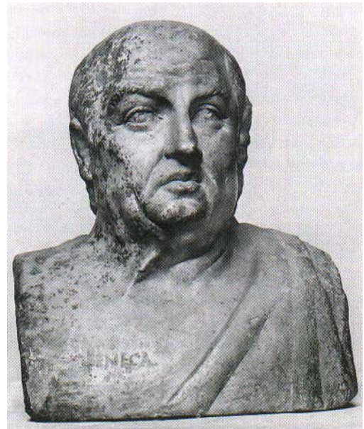
Lucius Annaeus Seneca 8

Lucius Annaeus Seneca ist „gegen Ende des Jahres 1 v. Chr. in Corduba geboren“ 5 . Er ist der zweite von drei Söhnen von seinem Vater Seneca, einem bekannten Rhetor, und seiner Mutter Helvia. „Die Annaei sind im spanischen Corduba eine alteingesessene, begüterte Ritterfamilie“ 6 , die traditionsbewusst den Glauben an die Republik und das Andenken des Pompeius pflegt 7 . Frühzeitig kommt er nach Rom und erhält eine philosophische Ausbildung unter anderem beim Stoiker Attalus, der ihn lehrt, „dass