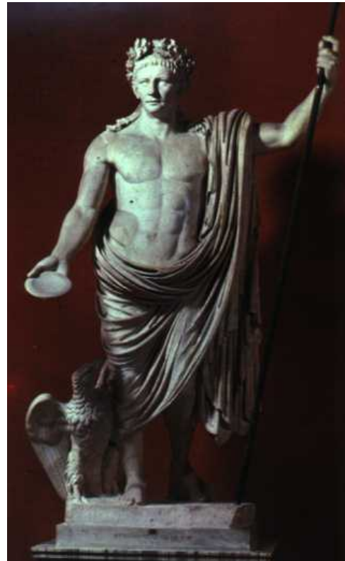
Kaiser Claudius 35

Claudius ist am 1. August 10 v. Chr. in Lugudunum geboren. Als er gerade ein Jahr alt ist, verliert er seinen Vater Nero Claudius Drusus. Seine Mutter Antonia kann nie ein gutes Verhältnis zu ihm aufbauen 32 , weil er einerseits eine schwere Geburt gewesen ist, die sie gerade noch überlebt hat und an dessen Folgen sie immer noch leidet, und andererseits sein Körper durch viele verschiedene Krankheiten sehr geschwächt worden ist und er geistig und körperlich zurückgeblieben ist 33 („per omne fere pueritiae atque adolescentiae tempus variis et tenacibus morbis conflictatus est, adeo ut animo simul et corpore hebetato ne progressa“ 34 ). Durch diese Krankheiten ist Claudius auf dem einen Ohr etwas schwer-